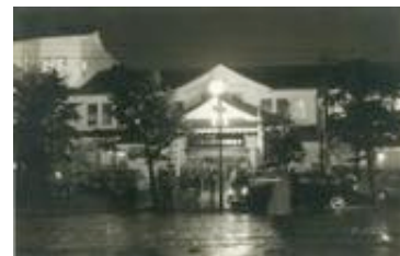
1970年頃の東京美術倶楽部外観

東京美術商協同組合は、厳しい入会基準を満たしたおよそ500店舗が加盟している美術商組合です。「東美アートフェア」のほかにも、1964年にオリンピックに合わせて開催され、国内アートフェアの先駆けとなった「東美特別展」や、1952年から続く「東美正礼会」を開催しています。