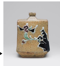
▶「花手扁壺」 河井 寛次郎

茶道を始めてみたいけど、きっかけがなかった方やビジネスパーソンへ向けた特別企画。 本格的な茶室で仕事帰りにお茶を点てる体験をしてみませんか？