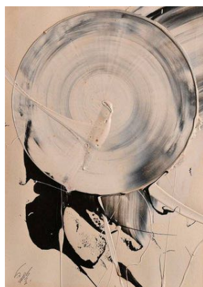
▲「無題」 白髪 一雄