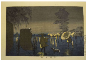
◀「柳原夜雨」 小林 清親